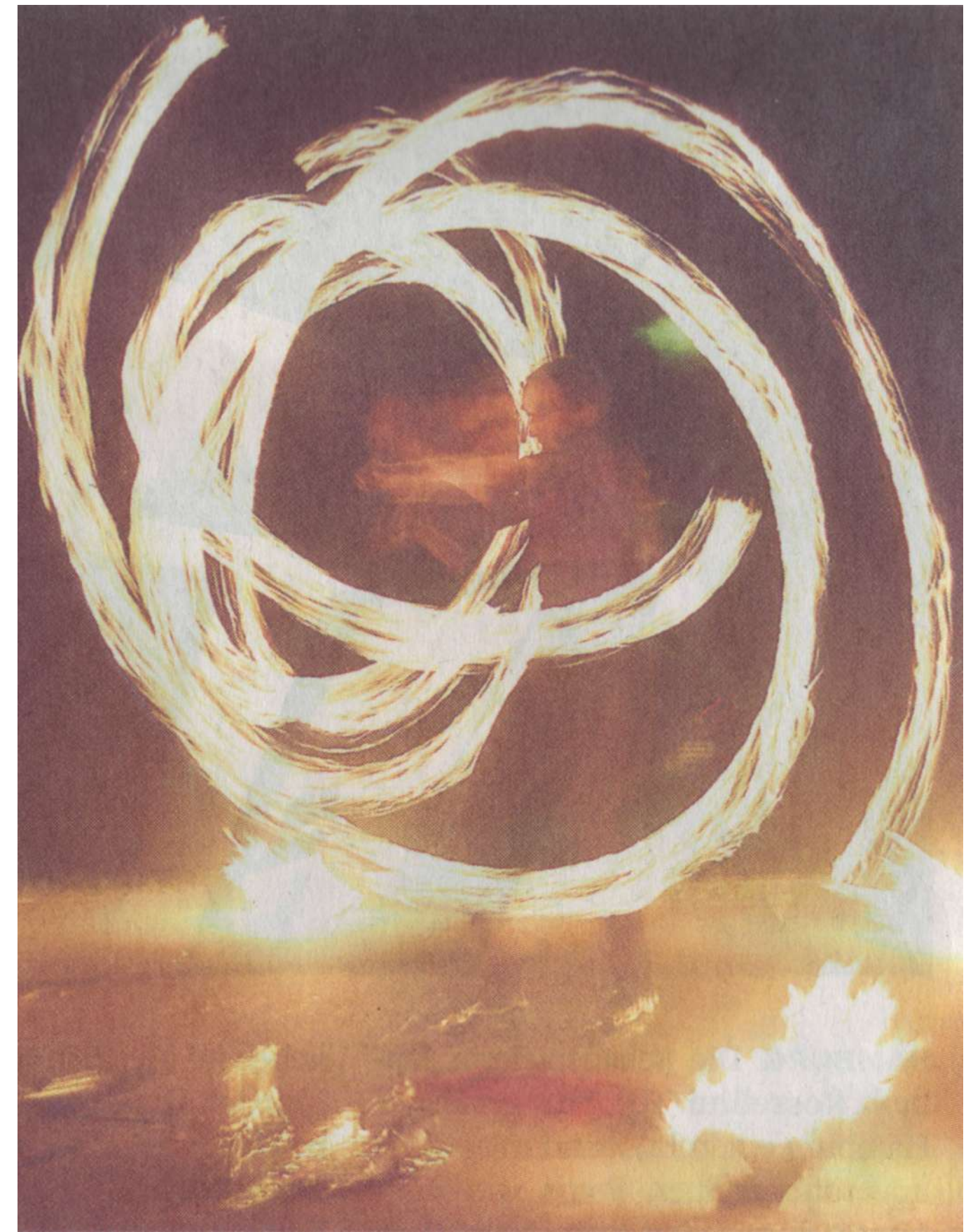
Gefährliches Spiel mit dem Feuer: Knut Keller beherrscht es perfekt - und verzaubert alle mit seiner spektakulären Show.